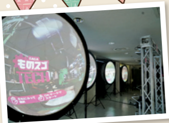
一昨年開催された、ものスゴTECHでの体験VRの展示。