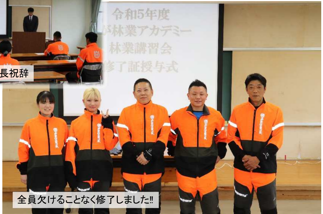
全員欠けることなく修了しました!!