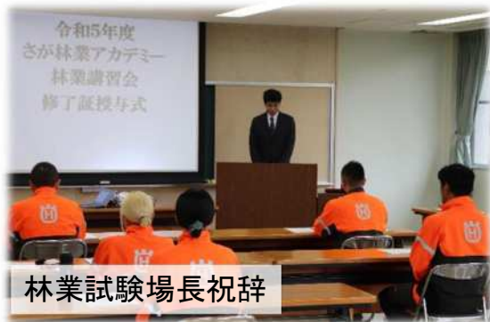
林業試験場長祝辞