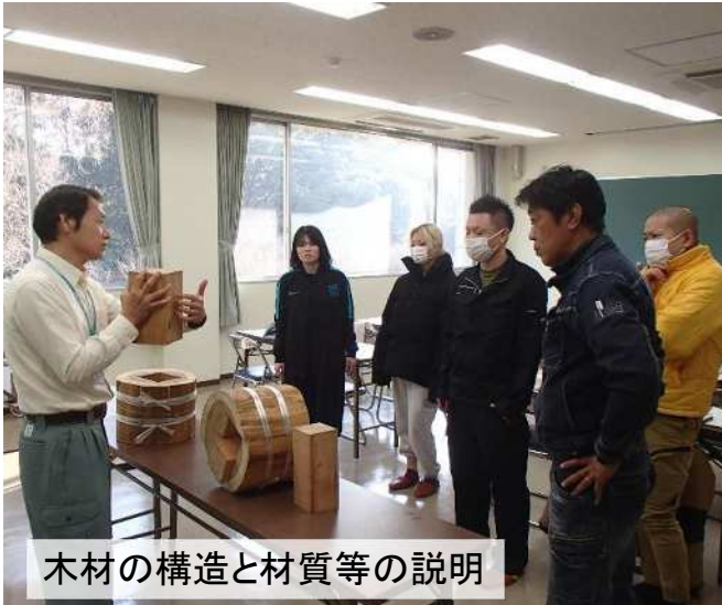
木材の構造と材質等の説明