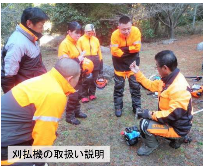
刈払機の取扱い説明