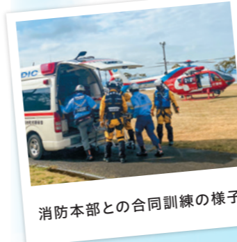
消防本部との合同訓練の様子