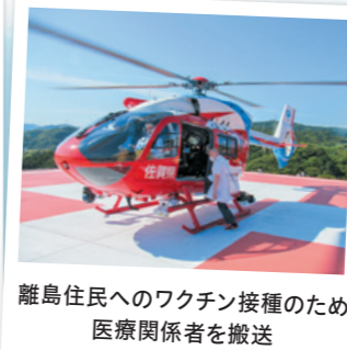
離島住民へのワクチン接種のため医療関係者を搬送