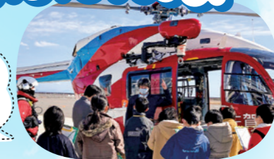
航空隊員が詳しく説明してくれます

昨年3月28日に消防防災ヘリコプター(愛称「かちどき」)の運用を開始して1年。これまで40件近くの緊急要請に対応し、さまざまな場面で活躍しています。緊急時にスピーディーかつ的確な活動ができるよう、隊員たちは日々訓練を重ね、県内各消防本部や関係機関との合同訓練も実施。県内ほぼ全域が15分圏内という機動力を活かし、これからも佐賀の安全・安心を守ります。