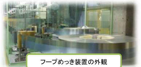
フープめっき装置の外観