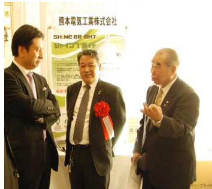
佐賀さいごう企業表彰（表彰懇談会）山口知事との懇談