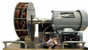
インナーローター発電機