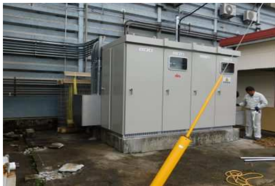
高圧受変電設備工事

※一般電気設備低圧、高圧受変電設備、計装設備、弱電設備、空調設備など基本的に官庁、工場、一般住宅など業態に関らず幅広く対応しております。又県内電気工事会社では数少ない電気保安管理部門を持ち、佐賀県立高校など電気保安管理業務など実績を持つ会社です。ものづくりでは、LED照明、大型スポットエアコンなど他社には無い当社の知的財産を活用した省エネは勿論環境をテーマに製品づくりを行っております。マーケティングではWEBで、商品周知を強化、最近ではアマゾンビジネス、楽天市場にも出展しSNS活用ユーチューブで動画発信などを行っております。