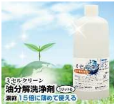
環境配慮型 油分洗浄剤