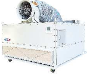
大型スポットエアコン 移動式