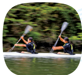
息の合った2人のパドルさばき