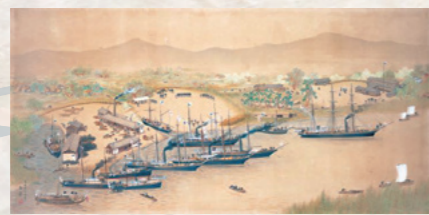
▲佐賀藩三重津海軍所絵図(公益財団法人鍋島報効会蔵)

1867年のフランス・パリ万博への佐賀藩出展時には渡欧、オランダへの軍艦建造の発注などの特命も受けていました。多大な任務の傍らで、戦傷者を救護する「赤十字」を知り、後の日本赤十字社創設につなげました。明治政府でも、ウィーン万博(1873年)に携わり、欧州の法制度や国士整備、産業、教育、文化など広範な分野に関する報告書を著述。常民は与えられた使命以上に見聞を広め、日本の近代化への道を切り拓いたのです。