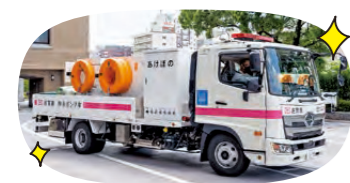
桃色ラインの「あけぼの」