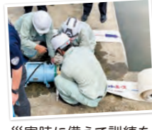
災害時に備えて訓練を重ねています

プロジェクトIF(内水対策プロジェクト)の一環として、豪雨による大規模浸水や内水氾濫に備え、県内に5台の排水ポンプ車を配備しました。25mプールの水を約10分で空にできる排水機能を持っています。県庁で行われたお披露目式では、赤・桃・青・黄・緑の5色のラインで塗り分けられた、5台の排水ポンプ車「ファイブスターズ」が勢揃い。子どもたちにも関心を持ってもらえるよう各車両には「ひので」「あけぼの」「はやぶさ」「みょうじょう」「きぼう」と人工衛星にちなんだ愛称をつけました。県内5カ所の土木事務所に配備し、いざというときに力が発揮できるよう訓練中です。