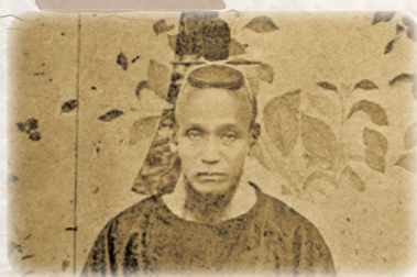
▲島の肖像

島義勇 (しまよしたけ) (1822~1874年) 佐賀藩士の家に生まれ、藩校弘道館で学ぶ。藩主の命を受けて蝦夷地探検に加わり、調査記録『入北記』を記した。明治天皇の侍従などを歴任。佐賀の七賢人の一人。