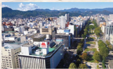
▲島が計画した札幌市の街並み

に道路や堀を配して防衛を意識した区割りで、本府近くに官舎や病院、学校を置き、大きな道を挟んで庶民の町を配置。周辺には農業生産を担う村落を築くなど、将来の発展を見据えていました。 着工は11月。厳冬期にかり、食料や資材が不足し、兵部省との間で意見が衝突しながらも建設を進めましたが、翌年2月、急きよ東京に召喚されて転任となり、建設は中断。しかし、一年後に工事が再開され、島の構想が実現していきます。札幌赴任中、島は「いつの日か、世界の都になるであろう」と漢詩に綴りました。札幌市は現在、人口190万人を超える大都市に発展。札幌市役所や北海道神宮には島の銅像があり、「判官さま」と慕われています。