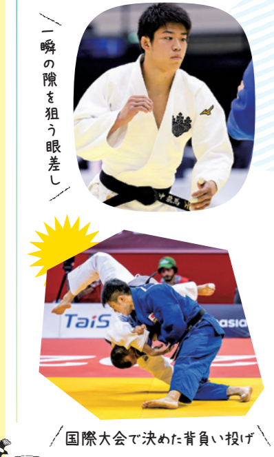
国際大会で決めた背負い投げ