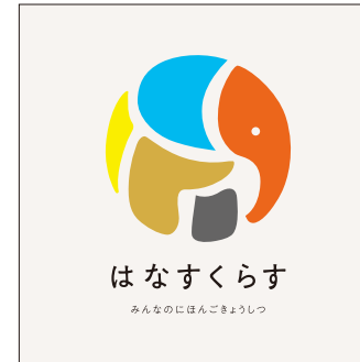
背景色ライトベージュ／カラーロゴ