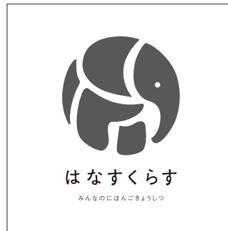
背景色ホワイト／モノクロロゴ