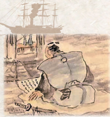
▲ 神陽先生拜楠神図 (部分、個人蔵/佐賀県立博物館寄託)

尊皇派として 早世、惜しまれた傑物 枝吉神陽は江戸時代末期に「日本一君論」を唱えた尊皇思想家で、佐賀藩尊皇派の中心だった人物です。明治維新の前に亡くなりましたが、新政府で活躍する大隈重信、江藤新平、副島種臣、島義勇、大木喬任らに多大な影響を及ぼし、「佐賀の吉田松陰」とも呼ばれます。 枝吉家は古代に大陸から渡来して朝廷に仕えた「大蔵氏」の一族とされています。神陽は藩校弘道館に学び、2度の江戸遊学を経て再び弘道館で教諭などを務めました。枝吉家から養子に出た副島種臣は神陽の弟。兄弟は父である枝吉南濠の影響を受けて尊皇思想を持ち、神陽も君主は天皇ただ一人であるとする「日本一君論」を主張しました。 嘉永3(1850)年には、南北朝時代に後醍醐天皇に尽くして忠義の象徴となった楠木正成を顕彰する「楠公義祭 （ごだいごてんおうのまきまさしげ） 」に肥前佐賀藩士。幕末の佐賀藩の思想家、教育者、国学者。藩校弘道館の教諭として大隈重信、江藤新平、大木喬任らを育てた。嘉永3(1850)年、義祭同盟を結成するなど幕末佐賀の尊皇派の中心的存在。