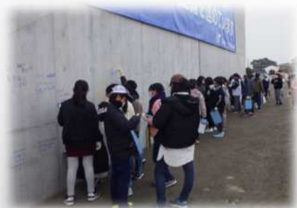
将来の夢をコンクリート壁面に記載