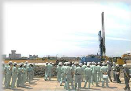
深層地盤改良の現場見学