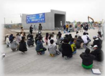
佐賀道路の現場での事前説明