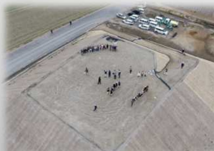
将来の道路となる盛土の上で記念撮影