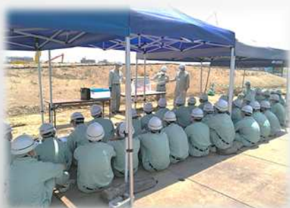
佐賀道路の事業・工事内容を説明