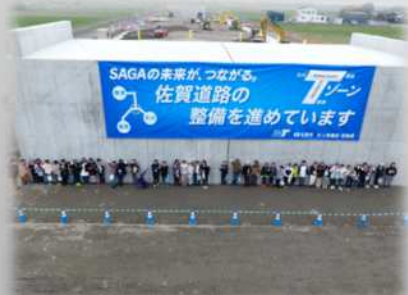
将来の夢を描いた後、記念撮影