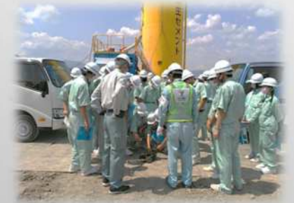
深度20mから採取した有明粘土の触感を体験