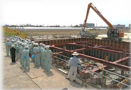
水路ボックスの現場見学