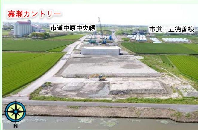
市道十五徳善線より北側 令和5年4月10日撮影