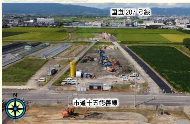
市道十五徳善線より北側 令和3年9月12日撮影