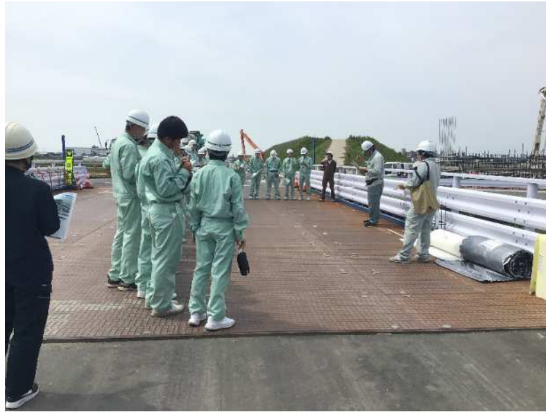
佐賀道路の事業概要について説明