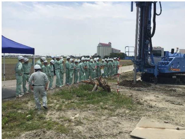
地盤改良の現場を見学