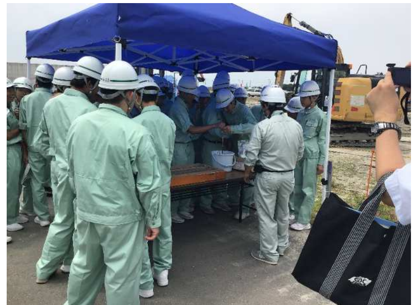
地盤改良前の粘土と改良後の土を比較