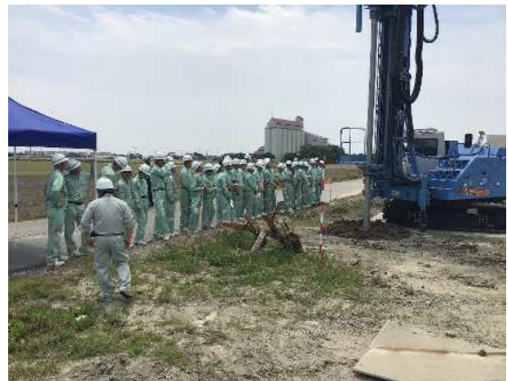
R6.7.2唐津工業高校 地盤改良の現場を見学