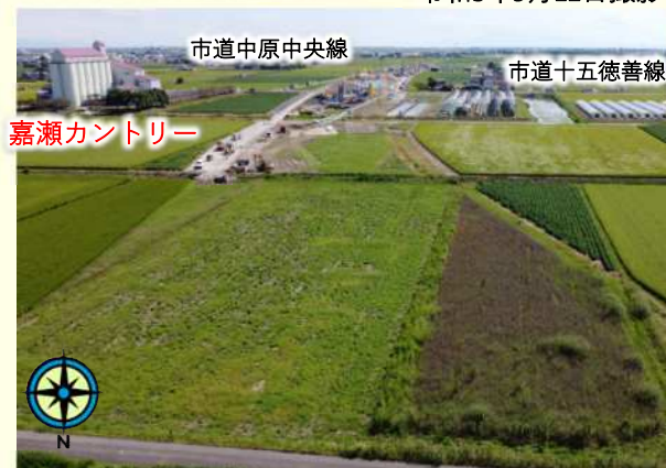
市道十五徳善線より北側