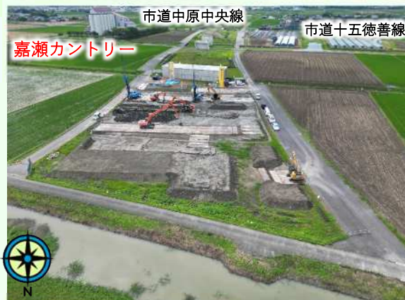
市道十五徳善線より北側