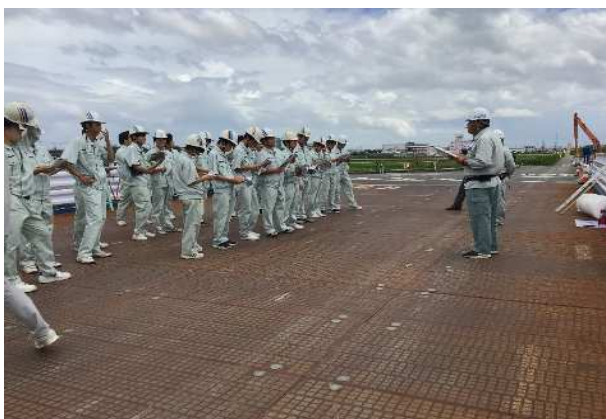
R6.6.6鳥栖工業高校 佐賀道路の事業概要について説明