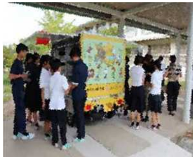
毎月の巡回が楽しみです！

これからも 利用者である 生徒や教職員の先生方に 必要とされる 「学校図書館」を目指して、 他機関と連携し 様々な取り組みを 行ってきたいと思います！