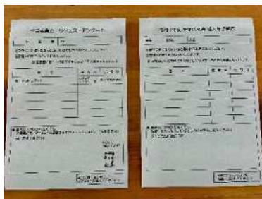
生徒用・教職員用 図書購入アンケート

限られた予算から必要な資料の選び、「夏の図書館まつり」に間に合うように本の受入作業を行いました。