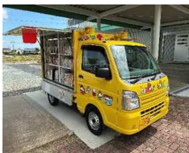
新移動図書館車「とりこさん号」