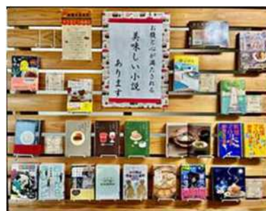
11月 お腹と心が満たされる 美味しい小説あります！

8. 教科書（国語）の掲載図書及び紹介図書の展示コーナー作り 9. 生徒昇降口に学校図書館からのお知らせを設置