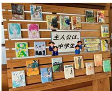
7月 読書感想文にもぴったりに！ 主人公は中学生！