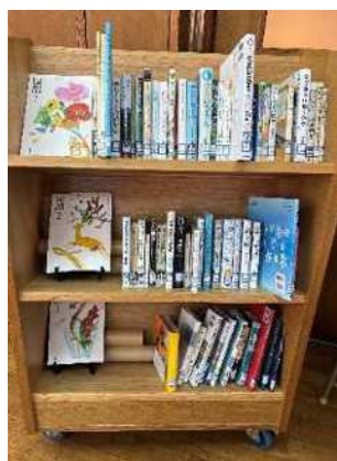
教科書（国語）コーナー

8. 教科書（国語）の掲載図書及び紹介図書の展示コーナー作り 9. 生徒昇降口に学校図書館からのお知らせを設置