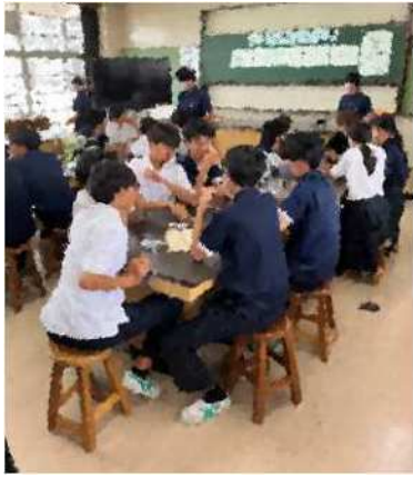
集まれ！ボブジテン大会

ボブジテンとは …、 カタカナ語（外来語・和製英語）を カタカナを使わずに説明し、 回答者から答えを導き出す コミュニケーションゲームです！ 「ボブジテン大会」では…、 4人グループの中に進行役として 専門委員会（学芸委員会）が1人入り、 大会を盛り上げました。 また、司会やタイムキーパーなどの 係を決め、限られた時間内にスムーズ に進行できるように準備をしました