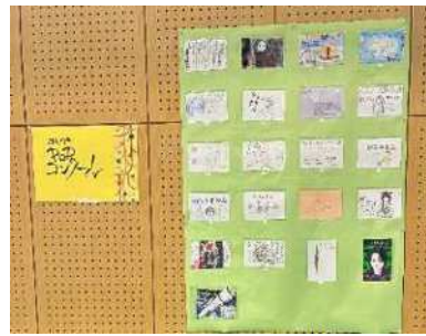
ポップコンクール