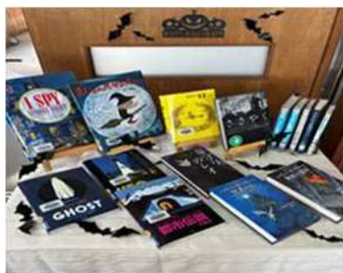
10月 ハッピー ハロウィン！