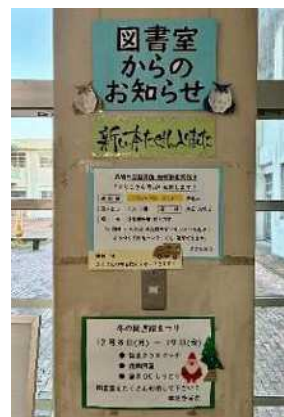
お知らせコーナー

その他に … 、 入試・検定対策コーナー 学習漫画コーナー 読書感想文 課題図書コーナー 本屋大賞コーナー 映像化原作本コーナー 戦争と平和コーナー などの 常設展示コーナーを作りました。