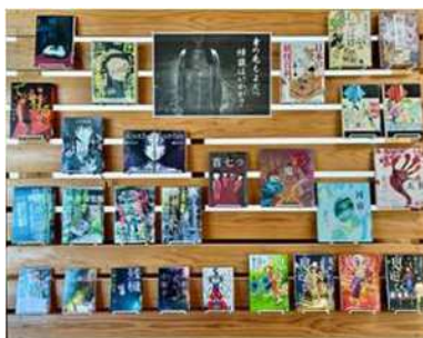
10月 身の毛もよだつ怪談はいかが！