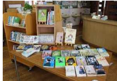
新しい本コーナー 9類・絵本