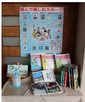
4月 進級・入学おめでとう！

掲示板や展示コーナーを活用し、手に取りやすくするために表紙を見せて本の紹介をしました。