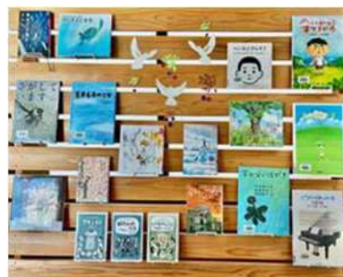
9月 戦争と平和について考えよう！