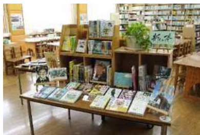
新しい本コーナー 0類 ～ 8類