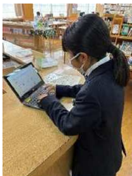
所蔵検索用タブレットが大人気です！