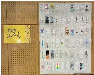
しおりコンクール