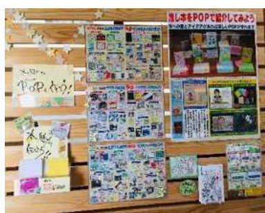
7月 ポップを作ろう！