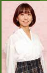
ゲスト 住吉美紀氏