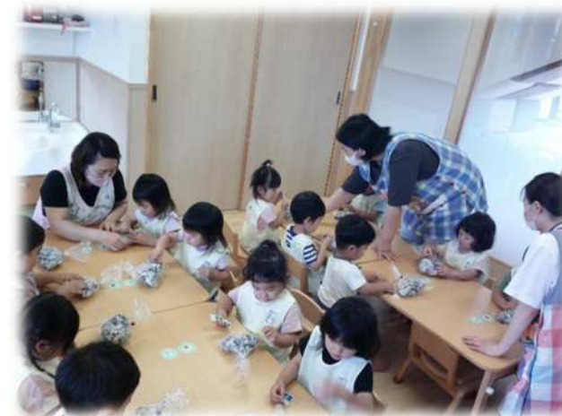
ワクワクドキドキ！ 何に変身するのかな？