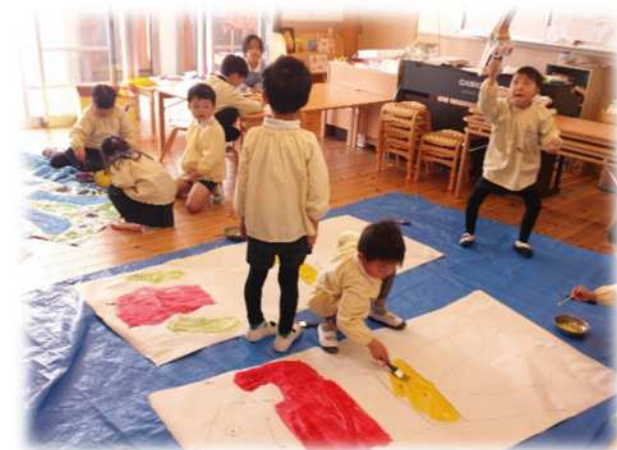
みんなで仲良く制作活動