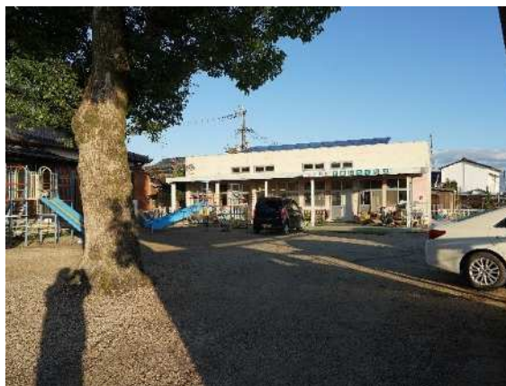
古い園舎から・・・