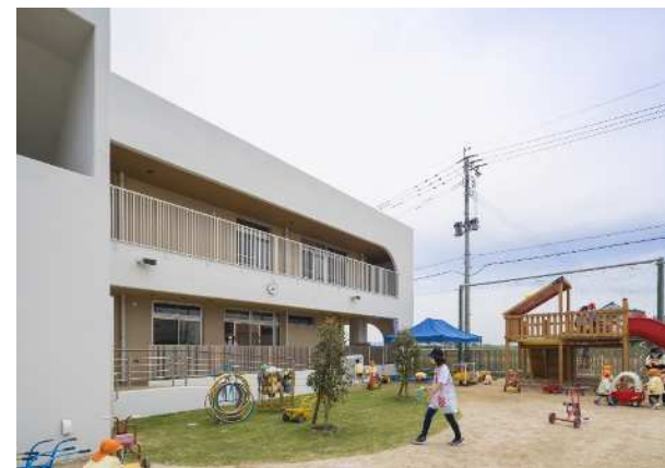
新しい園舎になりました