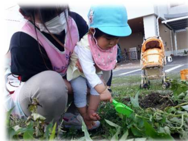
菜園で野菜を育てよう