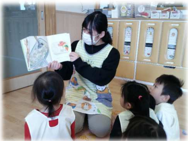
先生の優しい声で たのしい絵本の時間だよ