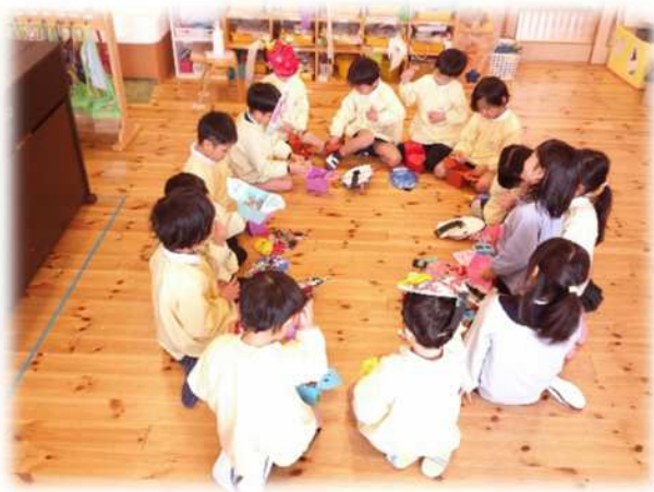
子どもたちで活動を考える