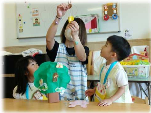
誕生日会、 今日はわたしたちが主役