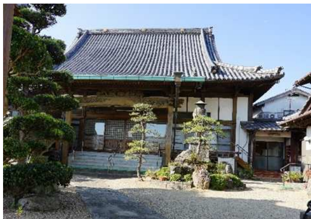
園の裏手に境内があります