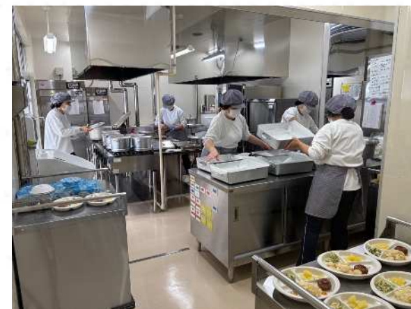
温かくて栄養満点の おいしい自校式給食