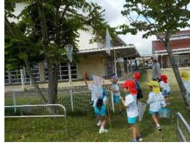
自然がいっぱいな 園庭での虫捕り