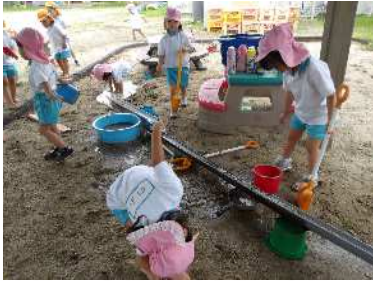
ダイナミックな遊び