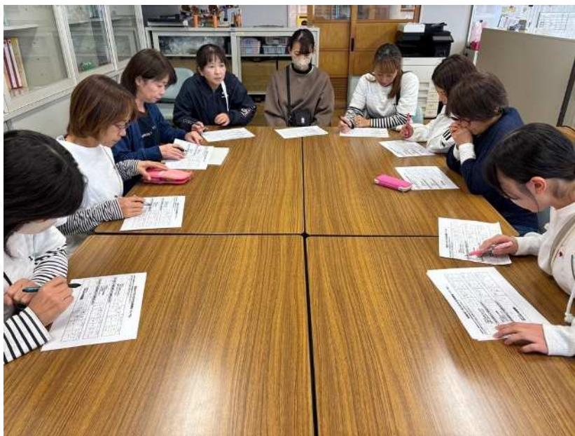
夕方の情報共有会議