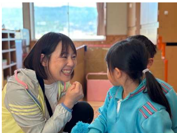
笑いとぬくもりに あふれたかかわり