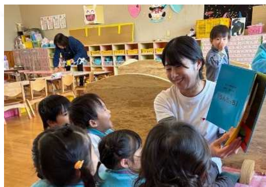
受容・応答を大切にした かかわり