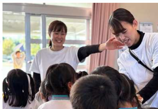
一人一人に寄り添った 丁寧なかかわり