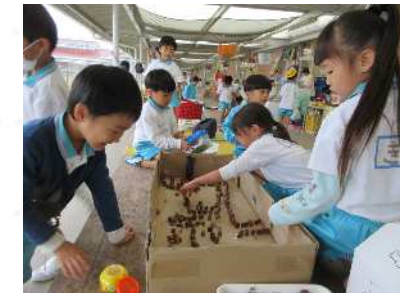
好きな遊びを好きな場所で 充分楽しめる環境

好奇心が高まる保育環境のなかで、 たくさんの友達とふれあい試行錯誤ができる三日月幼稚園