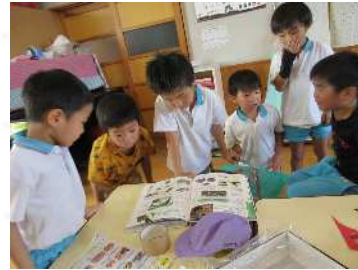
昆虫に興味関心が 高まる環境構成