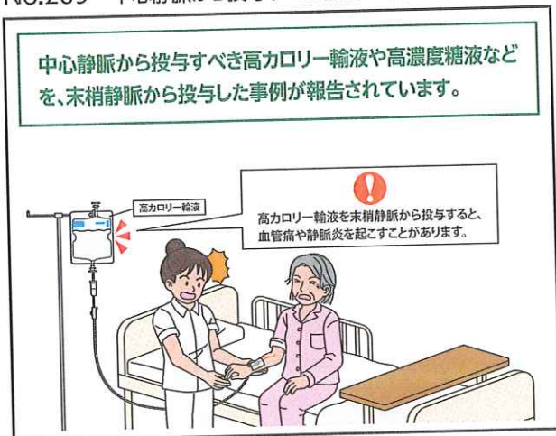
No.209 中心静脈から投与すべき輸液の末梢静脈からの投与