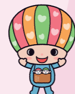
佐賀県子育て応援キャラクター「さがっぴい」

子どもの「救える命」を守るため、国指定の公的検査以外の2疾患(脊髄性筋萎縮症、重症複合免疫不全症)の県内での検査を可能にし、その費用を県が独自に負担します。