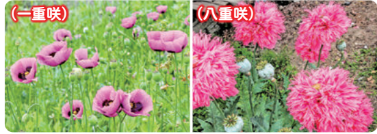
植えてはいけないけし

新緑の美しい季節になりました。畑や庭先などに「けし」が咲いていませんか? 「けし」の中には、法律によって植えることが禁止されている種類があります。植えてはいけない「けし」を発見した場合は、最寄りの警察署、各保健福祉事務所または薬務課までご連絡ください。