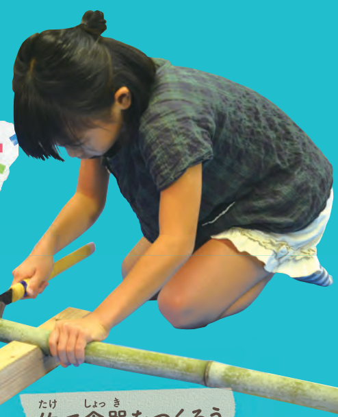
たけ しよつき 竹で食器をつくろう