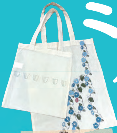
つか ハンを使って ぬの そ 布を染めよう

こ とし なつ き 今年の夏はコレで決まり! じ ゆう けん きゅう 自由研究をテイクアウト