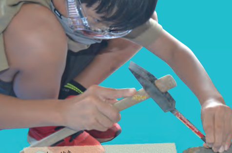
かせき 化石クリーニング