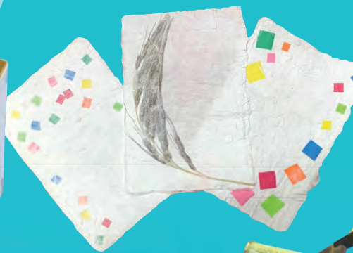
かみ たいけん 紙すき体験 わし -和紙のはがきをつくろう!-