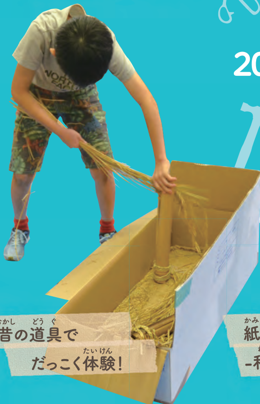
むかし どうぐ 昔の道具で たいけん だっこく体験!