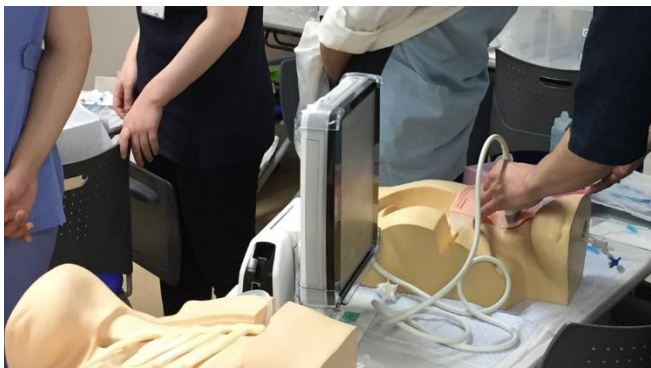
PhaseⅢのユニット構成とPBL/CBLの実施

⇒卒後のキャリアをイメージするため、特定診療科（小児科、産婦人科、救急科、麻酔科等）を中心に開催