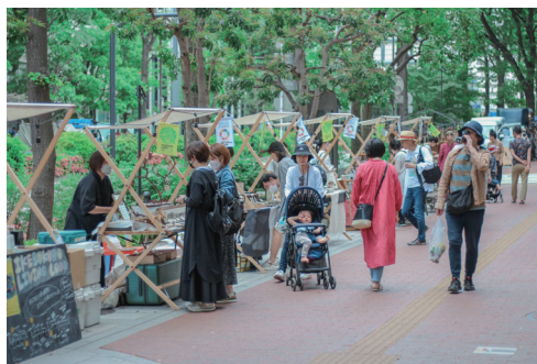
移動式の屋台や仮設店舗