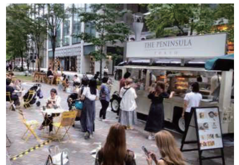
キッチンカーなどの移動販売車

※ 上記の他に、テーブルや椅子、看板などの各種広告物、自転車駐車器具、展示会など催しのために設けられる施設などで、歩行者の利便の増進に資するものを設置することが出来ます。