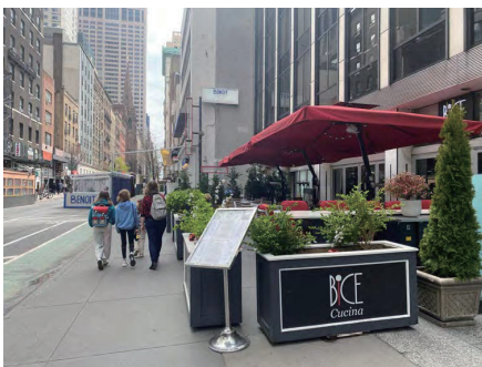
沿道店舗軒先のテラス席