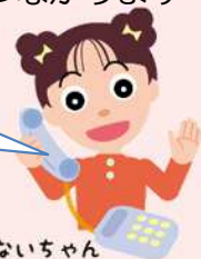
だまされないちゃん