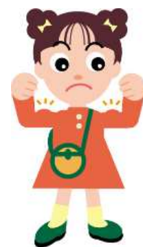
だまされないちゃん

このルールに違反する表示により、消費者が誤解し申し込んだ場合、消費者は契約の取り消しができる場合があります。