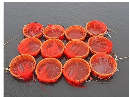
図2 2022年1回目の養殖試験区