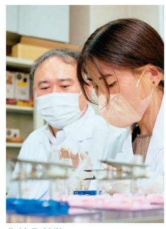
化粧品科学共同研究講座の様子