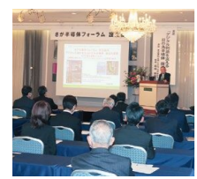
さが半導体フォーラムの様子

県では、佐賀の未来を拓く成長産業である半導体産業やコスメティック産業などにおいて、人材確保・育成や取引拡大、企業誘致を推進します。 半導体産業では、産学官で構成する「さが半導体フォーラム」による、半導体産業の可能性を若者に発信するシンポジウムや工場見学ツアーを開催します。また、関連企業に最新の業界動向や技術情報を共有するトップセミナーの開催、首都圏などの展示会への出展支援などにより、県内企業の連携強化や取引拡大を通じて産業の更なる成長につなげます。