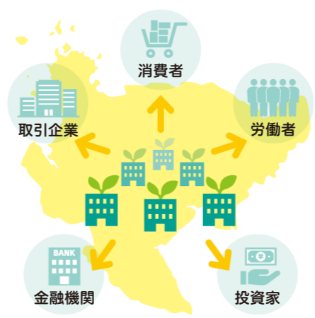
事業の目指す姿は、GXに取り組む企業が、取引先や消費者などに選ばれるようになること