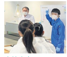
高校生向けセミナーの様子