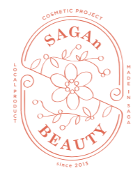
化粧品セミナーを開催するなど、未来を担うコスメ人材の育成にも取り組めます。

県内の多くの事業者が、後継者不足に直面していることから、県では、「後世に残したい店※」を選定することで、事業承継への機運醸成を図っています。これまで第三者承継※2のマッチングが150件以上成立しましたが、まだ6〜7千社で後継者が見つかっていません。 このため、今年度から、「佐賀の事業をつなぐプロジェクト」を立ち上げ、第三者承継の成立を加速させるため「事業引継ぎ奨励金」を創設しました。また、事業承