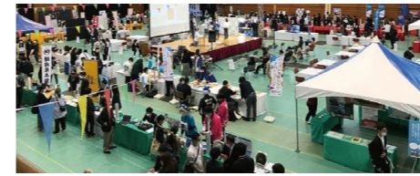
さがを深く知る大交流会「サガシル」の様子