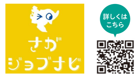
佐賀県就職情報サイト「さがジョブナビ」

2050年カーボンニュートラル※の実現に向け、脱炭素や温暖化対策を経済の成長につなげるグリーン・トランスフォーメーション(GX)が国内外で進められており、社会の機運も高まっています。 県では、県内企業のGXの取組を広めるために、モデル企業を創出します。企業経営の脱炭素化に向けた課題などを多角的に把握し、その課題解決に向けた支援を行い、脱炭素を推進しながら企業の成長につなげていきます。 また、モデル企業の取組事例を広く紹介し、他の企業への普及を目指します。 ※政府は2050年までに温室効果ガス(CO2)などの排出量と吸収量をプラスマイナスゼロとするカーボンニュートラルを目指すことを宣言