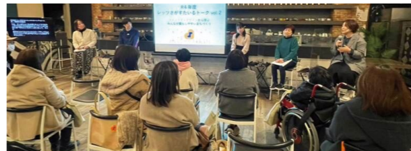
交流イベントの様子

お年寄りや障害のある方、子育て・妊娠中の方など、みんなが自然に支え合い、心地よく過ごせる、佐賀らしいやさしさのカタチ「さがすたいる」を広める取組を行っています。例えば、障害のある方など当事者の意見を取り入れた人にやさしい施設やサポート体制を専用サイトで紹介したり、誰もが安心して参加し、楽しめるイベント