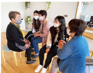
外国人と地域住民との交流会