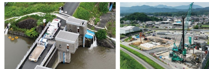
排水ポンプ車による排水の様子 広田川排水機場の施工状況

特に令和3年8月豪雨では、令和元年佐賀豪雨と同じ場所で内水氾濫が起き、県内各地に大きな被害をもたらしました。このため、県では、被害を軽減し、二度と同様の被害とならないよう内水対策プロジェクト(プロジェクト)を立ち上げ、その対策に特に力を入れて取り組んでいます。