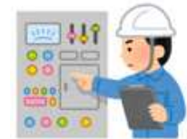
自動化設備導入によるデジタル化で生産性向上