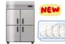
飲食店のメニューを冷凍食品に加え販売