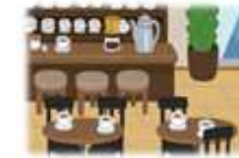
旅館の一部をカフェに改装し売り上げ向上