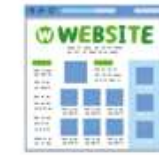
HP・ECサイト構築による広報強化、売り上げ向上