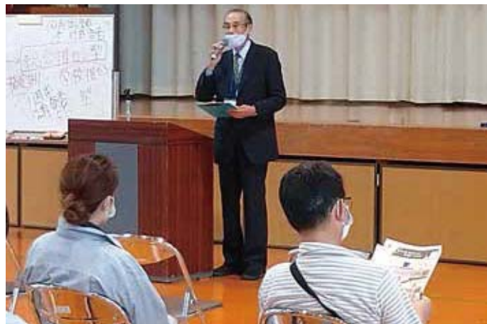
【保護者向けの説明会を開催している学校もあります】