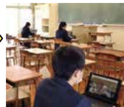
自身の在籍校で受講 (密を避ける環境で)