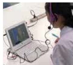
最寄りの県立学校で受講