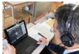
オンライン授業をする教諭