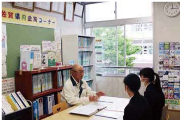
【生徒の個別相談も受け付けています】

「佐賀県にはどんな企業があるの?」「どんな仕事があるのかな?」「成長を見守れるように県内で就職して欲しいのだけど?」等々、気軽に相談してください。