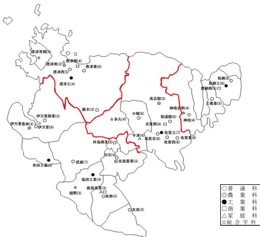
平成24年度 大学科別 学校数・学級数一覧（全日制）

【参考】平成24年度県立高等学校(全日制)の通学区域と配置（( )の数字は募集学級数）