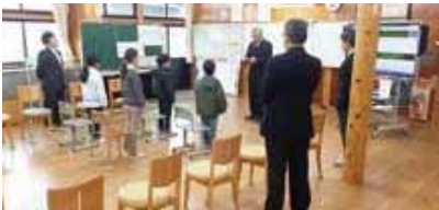
▲高島小学校での表彰式の様子

5月は消費者月間です 唐津市消費生活センター(市民相談室内) ☎73-0999 (平日) 佐賀県消費生活センター ☎0952-24-0999 (土・日・祝日)