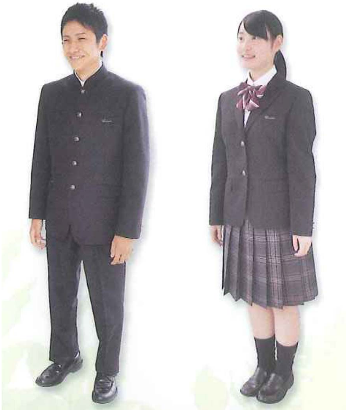
「嬉野高等学校【新設】パンフレット」より