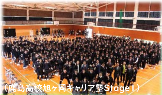
(鹿島高校旭ヶ岡キャリア塾Stage1)