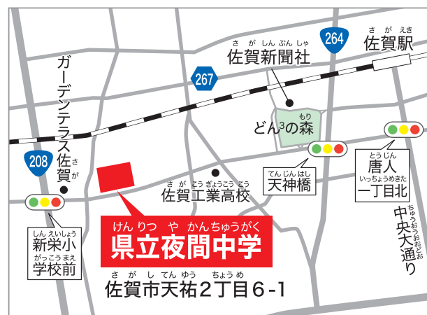
佐賀駅から徒歩約25分 佐賀市営バス「北高前」停留所から徒歩約1分