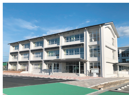
佐賀北高校通信制校舎内に設置