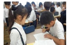
【スキルタイム相互参観】