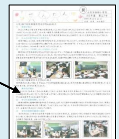
「学校だより(せんだん)」

・全員が前向きに授業に向かっているととても良かったです。 ・簡単なようで学級経営がきちんとできていないと、今回の授業のような小グループの話し合いの活動は成立しません。 ・0年生は人前で発表できる子ども達が増えてきているので、この力をさらに伸ばしてほしいです。