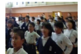
【西部っ子暗唱発表会】

「西部っ子ニュース」において、全学年で、月1回、テーマ作文に取り組み、書く活動の充実を図る。校長が全児童の作文を読み、一人一人の作文にコメントを書いて全校掲示を行う。そうすることで、子どもの意欲や文章を書く力を高め、表現力の育成を図る。