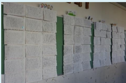
「西部っ子ニュース」

「西部っ子ニュース」において、全学年で、月1回、テーマ作文に取り組み、書く活動の充実を図る。校長が全児童の作文を読み、一人一人の作文にコメントを書いて全校掲示を行う。そうすることで、子どもの意欲や文章を書く力を高め、表現力の育成を図る。